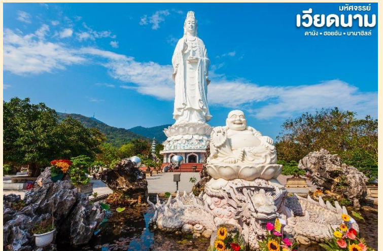
เวียดนาม มัทจรรย์ ดานัง • ฮอยอัน • บานาฮิลล์

เป็นอีกหนึ่งสถานที่ท่องเที่ยวที่สวยงามเป็นอีกหนึ่งจุดชมวิวที่สวยงามของเมืองดานัง