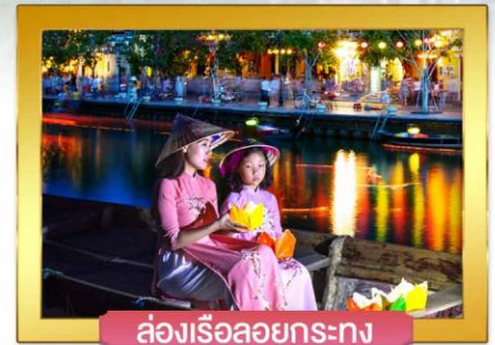
ล่องเรือลอยกระทง