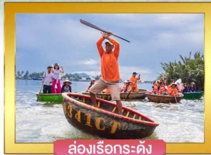
ล่องเรือกระดัง